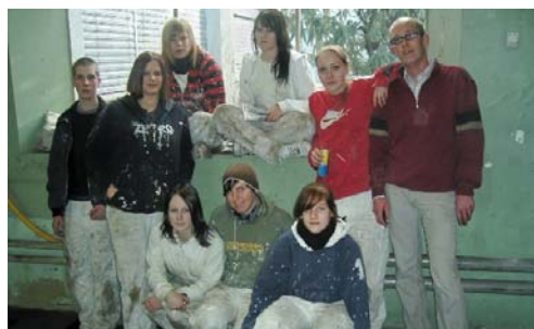
Gruppenfoto: Lernende mit Chef