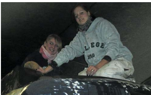
Frauenarbeit? - Selbstverständlich.

Während zwei Wochen im Januar 09 arbeiteten Lernende der Malerberufe und Lehrmeister aus dem Thurgau intensiv an unserem historischen Triebwagen bevor er dann im Februar in Altenrhein von Fachleuten professionell gespritzt wurde.