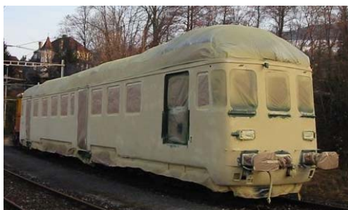
Verpackt und bereit zur „Fahrt“ nach Altenrhein in die Spritzkabine