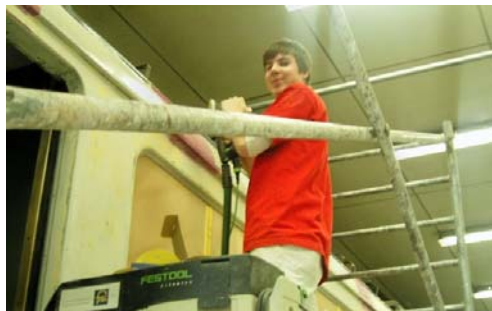
Spezielle Arbeiten machen mir Freude