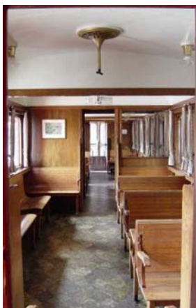
Bitte treten Sie ein!

Falls Sie es vorziehen lieber mit einer elektrischen Lok unterwegs zu sein, empfehlen wir Ihnen eine nostalgische Fahrt mit dem „Röbi“, der MThB Ee 3/3 Nr. 16318 aus dem Jahre 1928.