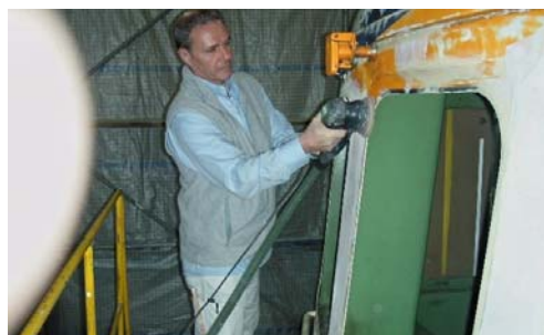
Fachmann am Werk