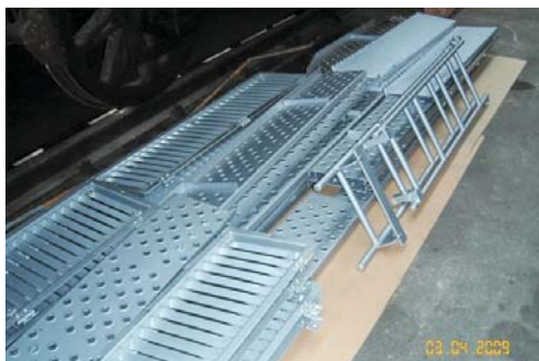
Alles glänzt wieder wie neu