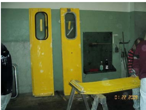
Bewegliche Teile wurden demontiert