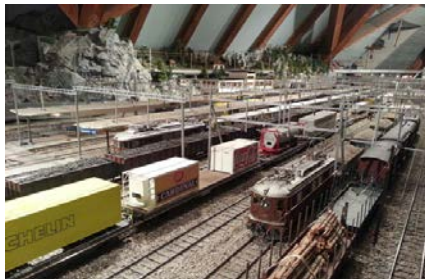
Güterbahnhof mit viel Betrieb