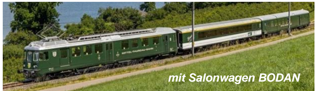
mit Salonwagen BODAN