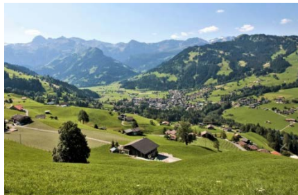
Simmental Richtung Wildstrubel

Die Quelle der Simme („Sibe Brünne“, Siebenbrunnen), mit sieben Haupttästen, sprudelt aus einer mächtigen Kalksteinwand und wird aus versickertem Schmelzwasser aus dem Hochgebirge, des zwischen Wildstrubel und Rohrbachstein liegenden Gletschers, gespiesen. Die Simmenfälle befinden sich zuhinterst im Talabschluss, fünf Kilometer hinter dem Dorf Lenk.