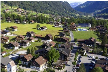
«Mir gönd a d'Lenk... dänk!»