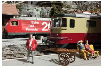
Stimmige Szene am Bahnhof