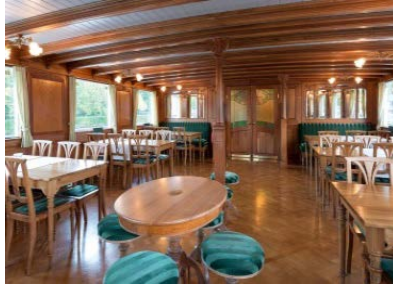
„Blümlisalp“ (Salon Hauptdeck)