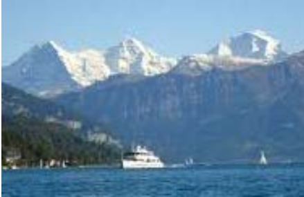
Eiger – Mönch – Jungfrau

Interlaken liegt zwischen dem Thunersee und dem Brienersee, auf einer „Bödeli“ genannten Schwemmebene. Um 1130 wurde da ein Bethaus aus Holz erbaut, woraus später das Kloster Interlaken hervorging. Um 1800 wurde die eindrückliche Bergwelt von Reisenden entdeckt und beschrieben (J.W. von Goethe). Grossen Aufschwung erhielt der Fremdenort durch den Bau der Berner Oberland Bahnen und der Jungfraubahn 1912. 1913 wurde der Schiffskanal vom Thunersee bis Interlaken-West eröffnet. Während des 2. Weltkrieges beherbergte die Villa Cranz (heute Gemeindeverwaltung) von 1941-1944 das Armeehauptquartier General Guisans.