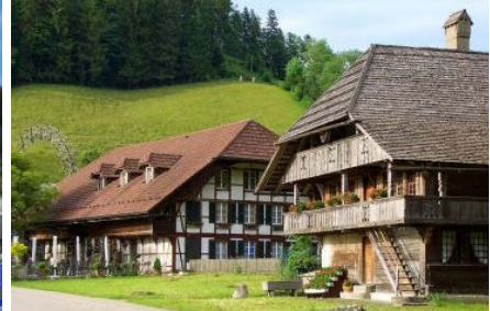
Töpferei und Heimatmuseum