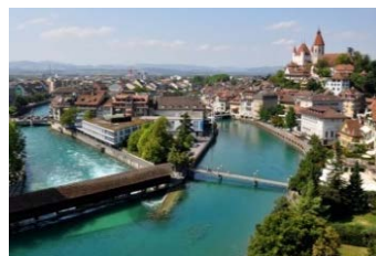
Thun an der Aare