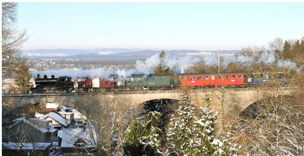
Der beliebte «Mostindien-Express», gezogen von der letzten Thurgauer Dampflokomotive

Dampfzug mit MThB-Dampflokomotive Ec 3/5 Nr. 3 auf dem Viadukt Jakobshöhe kurz vor Bernrain